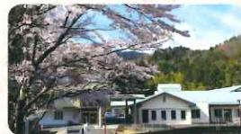
▲特別養護老人ホーム美松苑

当法人は1991年に設立し、湖南省・甲賀市で高齢者施設5カ所と障がい者施設1カ所を運営。地域福祉の拠点として地域や歴史を大切にしながら運営を行うと共に、業界のイメージアップや働き方改革、職員の処遇改善に注力しています。介護の仕事は知識や技術が必須と思われがちですが、福祉系の勉強や介護の経験がなくても始められます。働きながら知識や技術の習得、資格取得なども可能であり、学歴に関係なく本人の意欲があればどんどん上を目指せる業界です。これから介護職の需要はさらに高まります。IT化・ロボット化が進んだとしても、人のぬくもりを代替することはできません。私たちの仕事に少しでも興味があれば、思い切っただ飛び込み、自らの目で見て、体験して、介護の仕事を自分で評価してみてください。