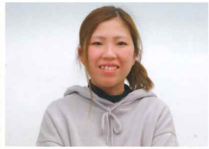
特別養護老人ホーム美松苑 ショートステイ相談員

みんなで意見を出し合いながら楽しく働ける環境です。ステップアップのための制度も充実しており、子育て中の仲間も多いので、働きやすい職場だと思います。