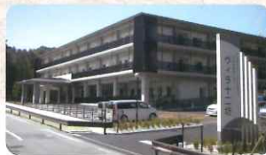
▲特別養護老人ホーム ヴィラ十二坊