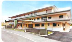
▲特別養護老人ホームレーベンとはがひら